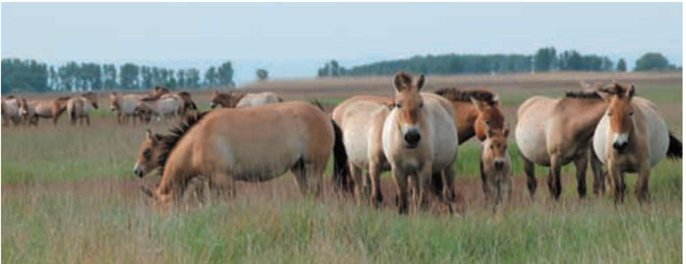
Abb. 21: Nach 7 Jahren haben die Przewalskipferdgruppen in Pentezug gelernt, sich in der Nähe zu dulden und überlappende Streifgebiete zu nutzen.

After 7 years the Przewalski's horse groups in Pentezug have learnt to tolerate each other close by and to use the overlapping home-ranges.