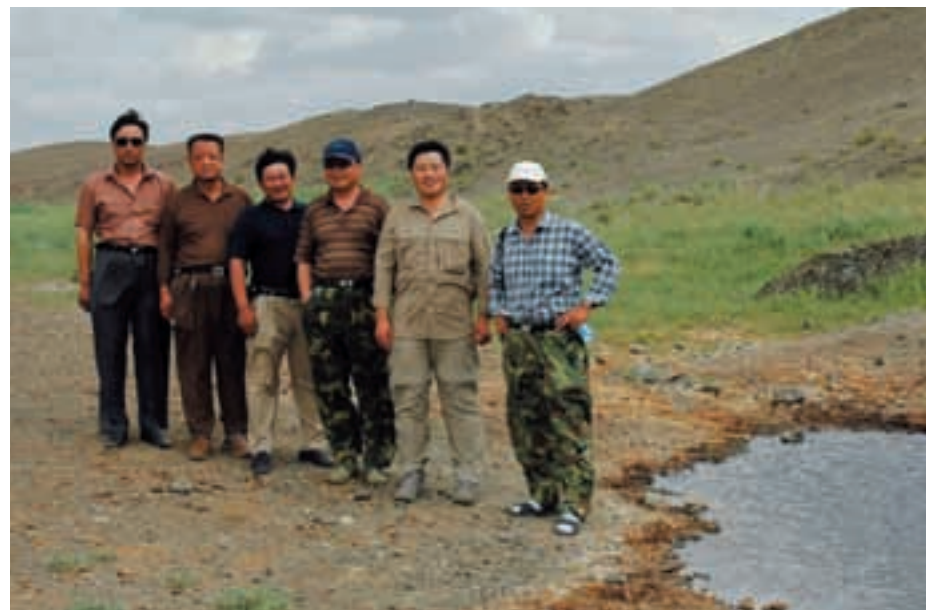
Abb. 49: Unsere chinesischen Kollegen an der Wasserstelle eines neu gewählten Biotops für die nächste Auswilderung von Przewalskipferden im Kalameili-Reservat. Our Chinese colleagues near a water place of a newly chosen biotope for the next release of Przewalski's horses.

Der Kölner Zoo machte eine schnelle Umsetzung des im Juni geschlossenen Abkommens möglich. Bereits im September dieses Jahres flogen 6 Hengste aus dem EEP nach Urumqi (Abb. 50). Da in der Provinzhauptstadt von Xinjiang keine großen Frachtmaschinen landen, machte LUFTHANSA eine Ausnahme und legte auf der Route nach Shanghai einen Zwischenstopp ein. Die aus den Zoos von Karlsruhe, Köln, Leipzig und Stuttgart stammenden Hengste überstanden die Strapazen gut und konnten inzwischen auch das Quarantänegehege verlassen (Abb. 50). Der Hengst aus Springe erlag leider nach 2 Wochen einer Rippenfellentzündung, die vermutlich traumatisch bedingt war und von einem Schlagabtausch zwischen den Hengsten herrührte.