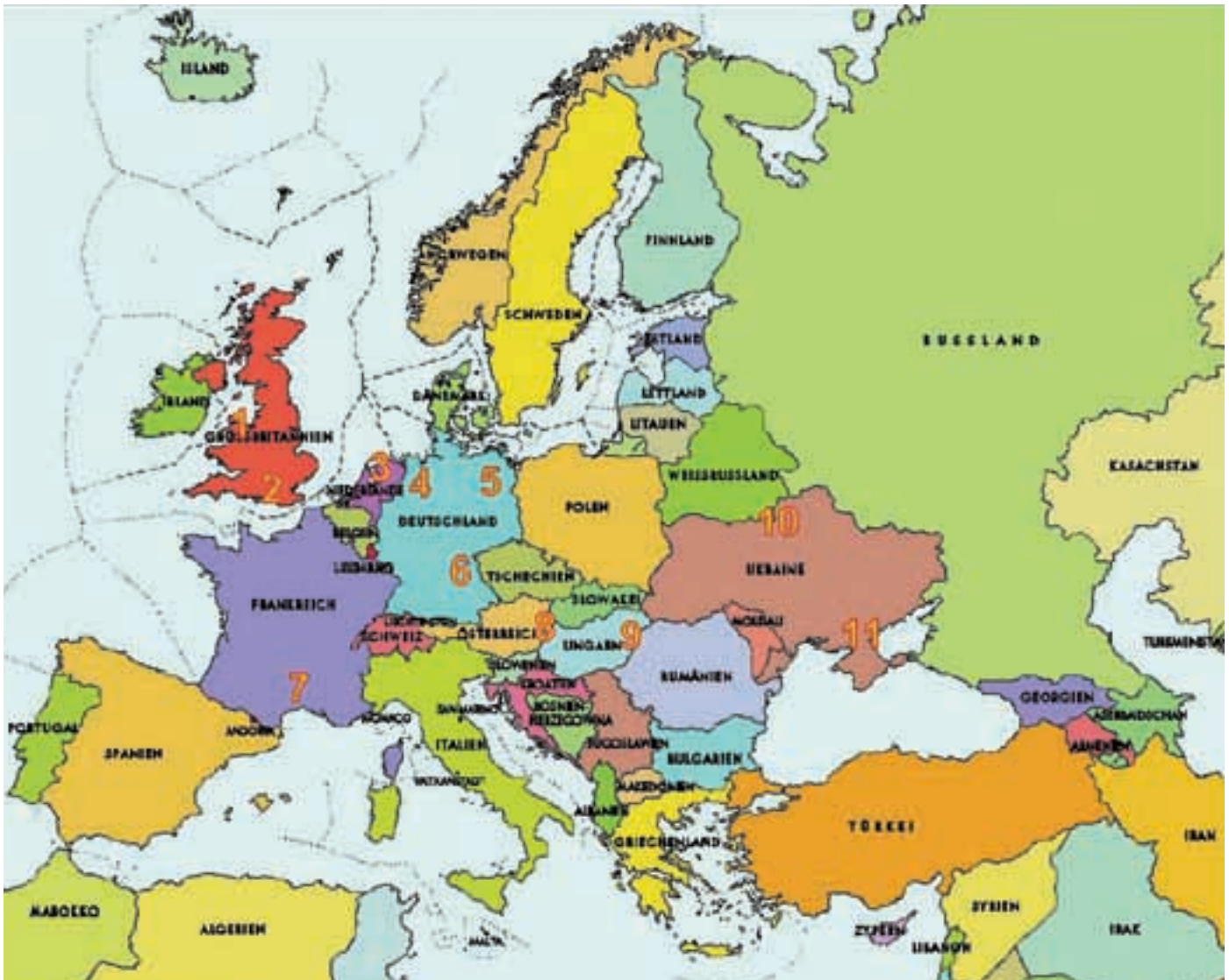
Abb. 2: Semi-Reservate in Europa (Semi-reserves in Europe): 1 Clocaenog Forest, 2 Eelmoor Marsh, 3 Lelystad, 4 Sprakel, 5 Schorfheide, 6 Tennenloher Forst, 7 Le Villaret, 8 Nationalpark Neusiedler See, 9 Hortobágy Nationalpark, 10 Chernobyl, 11 Askania Nova.

lichen Verbreitungsgebiet des Przewalskipferdes in der Mongolei und China.