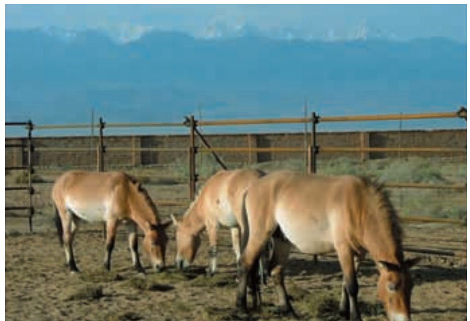
Abb. 51: Die neuen Hengste gewöhnen sich im Quarantänegehege des Wildpferdezuchtzentrums nahe Jimsar ein. The new stallions are acclimatizing in the quarantine station of the Wild Horse Breeding Centre near Jimsar.