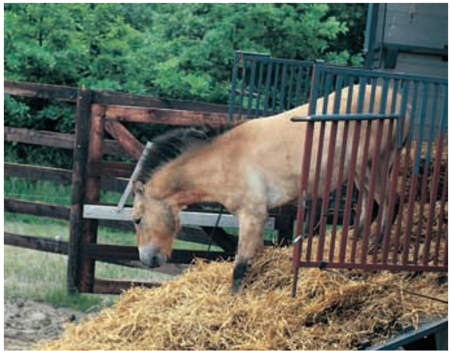
Abb. 3: Der Hengst Apoll aus der Kölner Zucht bei seiner Ankunft in Lelystad. The stallion Apoll , bred in Cologne zoo, arrives in Lelystad.

Als das holländisch-mongolische Projekt HUSTAINATIONALPARK im Jahr 2000 erfolgreich abgeschlossen, d.h. von Pferdeimporten aus Europa unabhängig war, beschloss die Stiftung, die Reserve ganz aufzulösen (NOORDERHEIDE, DE OOIJ, GOUDPLAAT) oder abzutreten: LELYSTAD gehört heute zur dortigen Naturparkverwaltung und SPRAKËL, da in Deutschland gelegen, wurde dankenswerterweise für den symbolischen Wert von 1 € dem Kölner Zoo zur Nutzung durch das Europäische Erhaltungszucht-Programm für Przewalskipferde (EEPP) angeboten. Und mit dieser Übernahme hat sich auch die Bedeutung dieses Reservates geändert. Das EEPP verfolgt ein etwas anderes Konzept als die holländische Stiftung. So viele Vorteile es auch hat, den Nachwuchs halb wild geborener