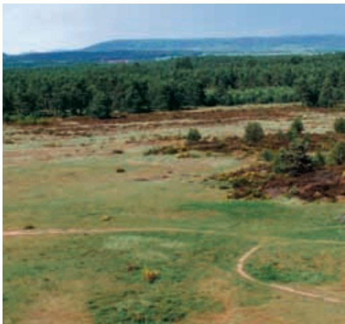
Abb. 14: Der Tennenloher Forst. The Tennenlohe Forest.

EELMOOR MARSH und SPRAKEL sollten hier Jungstuten heranwachsen, damit sie in ihrer Geburtsgruppe nicht vom Vater gedeckt oder aber von diesem vertrieben werden. Beides ist unerwünscht bzw. gefährlich. Im ersten Fall erhalten wir ingezüchtete Fohlen und im zweiten Fall kann die gejagte Jungstute im Gehege nicht ausweichen, um den Attacken des Vaters zu entgehen. Solch eingeschlechtliche Gruppen