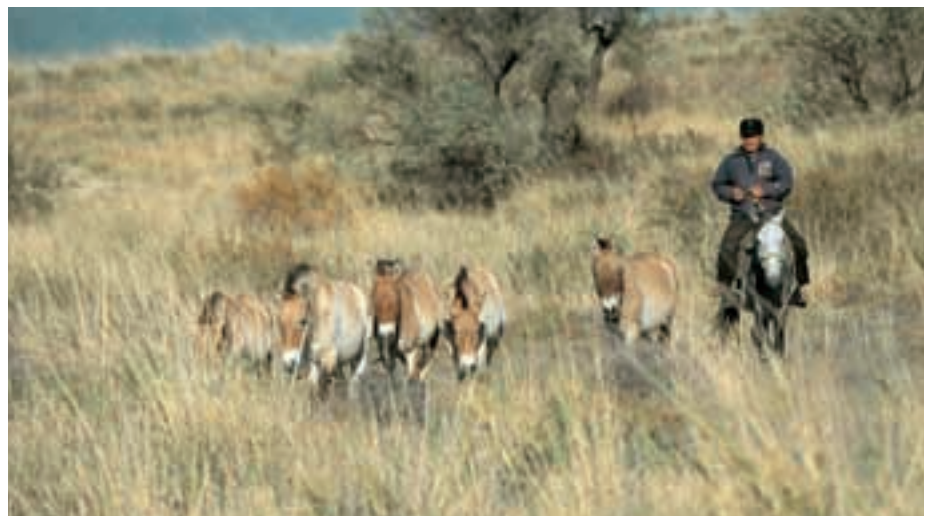
Abb. 32: Die Przewalskipferde im Altyn Emel NP werden zugefüttert. Das Bild täuscht: Der Großteil der Vegetation ist nicht fressbar. The Przewalski's horses in the Altyn Emel NP get additional food. The foto is pretending a good vegetation, but most of the plants are not palatable.

ist somit kein geeigneter Lebensraum für Przewalskipferde, die von Gräsern als Hauptnahrung abhängig sind. Landschaftlich ist es atemberaubend schön, da die Farben in den verschiedenen Bergen oder Sanddünen sehr unterschiedlich sind (Abb. 31). Da auch gute Straßen bzw. Wege in und durch den Park führen, ausreichend Wasser-