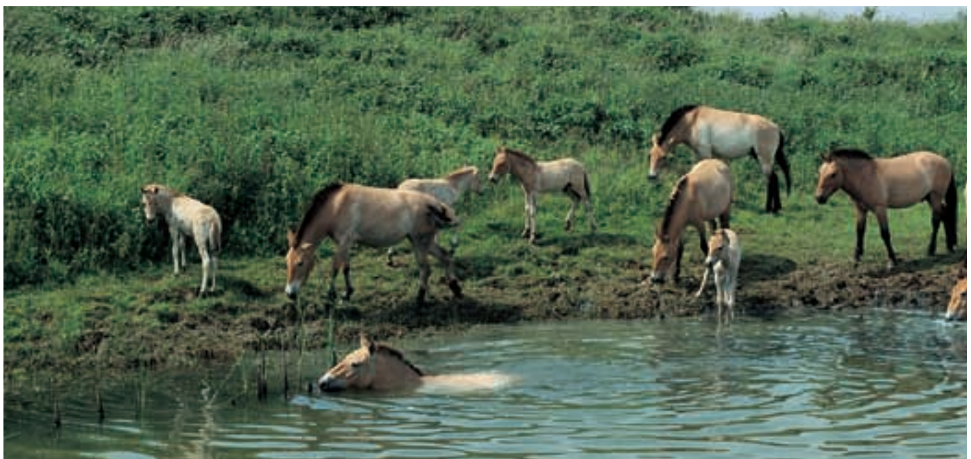
Abb. 4: Die Herde in de Ooij nimmt an heißen Tagen gern ein Bad. The group in de Ooij enjoys a bath during hot days.

„Ein Semi-Reservat ist eine umfriedete Vegetationsfläche, auf der in Abhängigkeit der vorhandenen Biomasse eine bestimmte Anzahl von großen