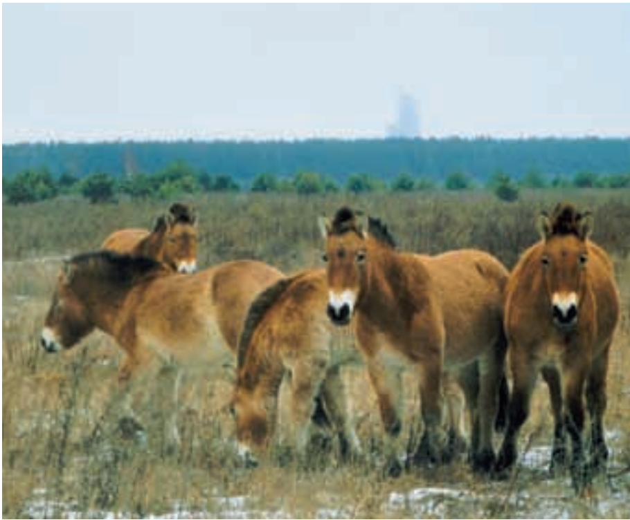
Abb. 27: Przewalskipferde in der Ausschlusszone von Chernobyl. Die aus Askania Nova stammende Gruppe mit dem Leithengst Vypad hat sich gut vermehrt. Przewalski's horses in the Exclusion Zone of Chernobyl. The group with the harem stallion Vypad originates from Askania Nova and has successfully bred.