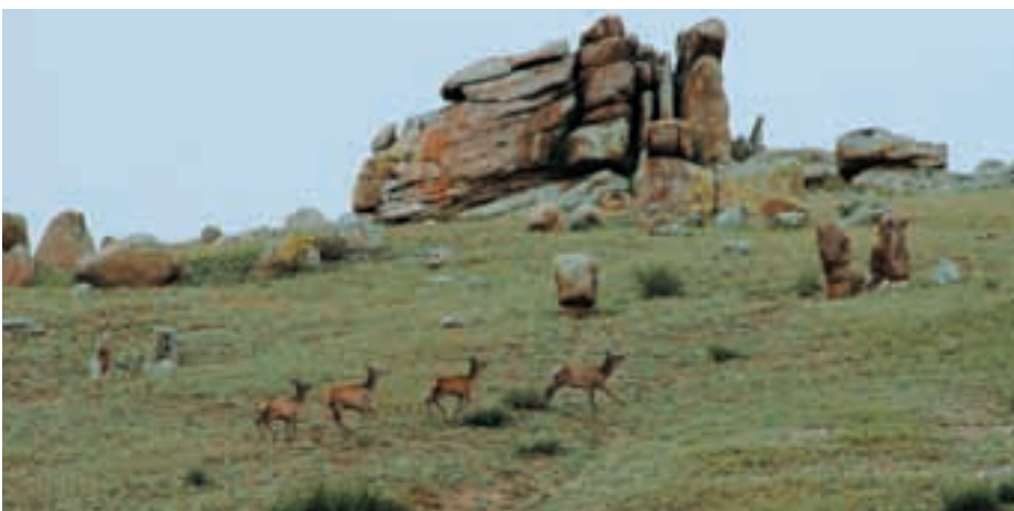
Abb. 36: Marale ( Cervus elaphus maral ) sind die Hauptbeute der Wölfe. Marals are the favoured prey of the wolves.

quellen und Unterkünfte vorhanden sind, spielt der Tourismus schon eine gewisse Rolle.