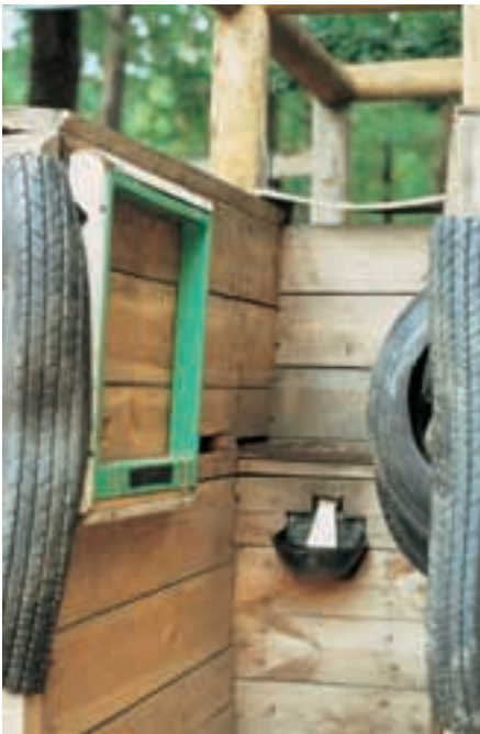
Abb. 17: An der Tränke kann der Wasserverbrauch der Individuen festgestellt werden. At the drinking bowl the water consumption of each individual can be registered.

von der FREIEN UNIVERSITÄT BERLIN Forschung an den Przewalskistuten betrieben. Zahlreiche Publikationen sind daraus entstanden und viele neue Erkenntnisse wurden so gewonnen (BERGER, 1993; BERGER et al., 1999; BULL, 1999; KALZ, 1994; MIEHLKE et al., 1996; PATAN, 2001; SCHEIBE et al., 1999). Einige Tiere tragen seit längerer Zeit Halsbänder mit Sensoren und Sendern, die z.B. ihre Aktivität und Tagesrhythmen im