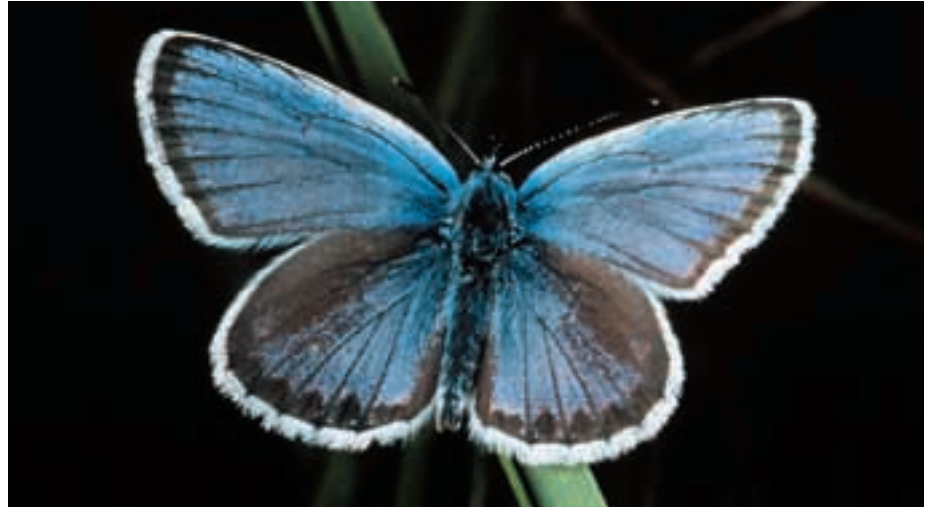
Abb. 9: Ein Argus-Bläuling ( Plebejus argus ) in Eelmoor Marsh. A Silver-studded blue in Eelmoor Marsh.

Für das EEP und die englischen Zoos dient EELMOOR MARSH als Zwischenstation für Junghengste, die im Alter von 1 bis 2 Jahren ihre Geburtsgruppe verlassen müssen. In einer Junggesellengruppe lernen sie auf spielerische Weise miteinander zu kämpfen, aber auch im sozialen Verband miteinander zu leben. Erst im Alter von ca. 5 bis 7 Jahren sind sie für die Zucht vorgesehen und werden in die verschiedenen Zoos versendet, wo schon Stutengruppen auf sie warten. Gleichzeitig werden hier wie in einigen anderen Reservaten Examensarbeiten zum Verhalten der Pferde vergeben, aber besonders auch zu ihrem Einfluss auf die Ökologie des Gebietes durchgeführt (DRAGANOVA, 1998;