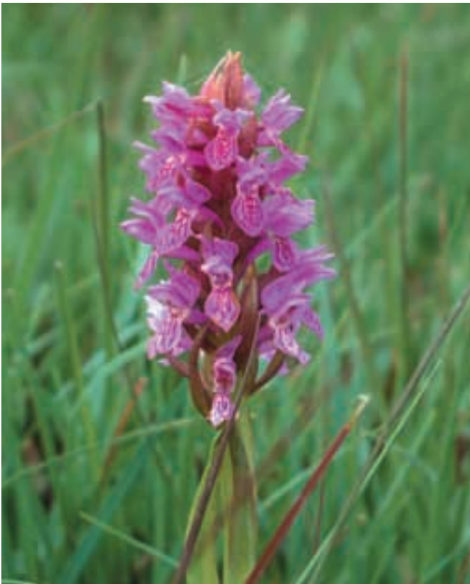
Abb. 5: Fleischfarbenedes Knabenkraut ( Dactylorhiza incarnata pulchella ) in Eelmoor Marsh. Early marsh orchid in Eelmoor Marsh.