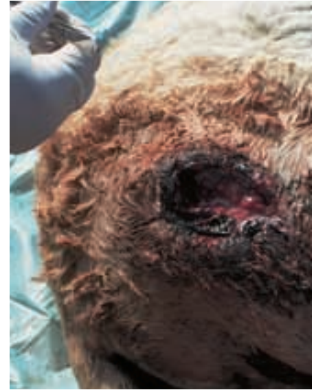
Abb. 38: Eine von Fliegenmaden hervorgerufene Wunde wird bei einem Przewalskipferdfohlen behandelt. A wound in a Przewalski's horse foal, caused by maggots, is treated.

Der HUSTAI NATIONALPARK umfasst ein 50.000 ha großes Bergsteppengebiet, etwa 150 km süd-westlich von der Hauptstadt Ulan bator. Der heilige Berg „Hustai“ erhebt sich 1.842 m über den Meeresspiegel. Das Gebiet zeichnet sich durch zum Teil alpine Flora (Abb. 34) und Fauna aus. Der Futterreichtum für die Przewalskipferde ist groß, denn durch den Schneereichtum wachsen die Gräser gut und dicht (Abb. 35). In diesem Gebiet wurden erstmals Beobachtungen an frei lebenden Przewalskipferden durchgeführt (BOYD, 1998; DIERENDONK et al., 1996; DIERENDONK & de VRIES, 1996; KING, 2005). Natürlicherweise kom-