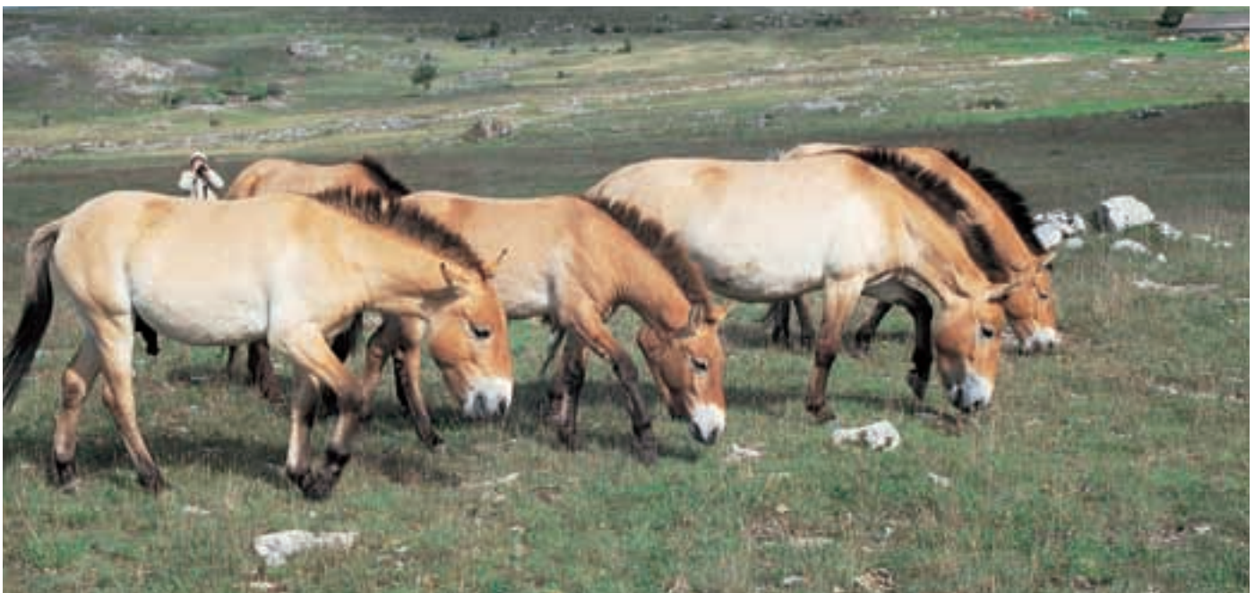
Abb. 23: Przewalskipferde im Semi-Reservat von Le Villaret. Przewalski's horses in the semi-reserve of Le Villaret.

1856 erwarb der deutsch-stämmige Siedler und biologisch interessierte Friedrich Fein 60.000 ha Land 100 km westlich von Kherson für 525.000 Taler. Aus einer Verbindung mit der ebenfalls emigrierten Familie Falz ging der Zweig der Falz-Feins hervor, die von Zar Nicholas II für ihre Verdienste im Bereich der Kultivierung der