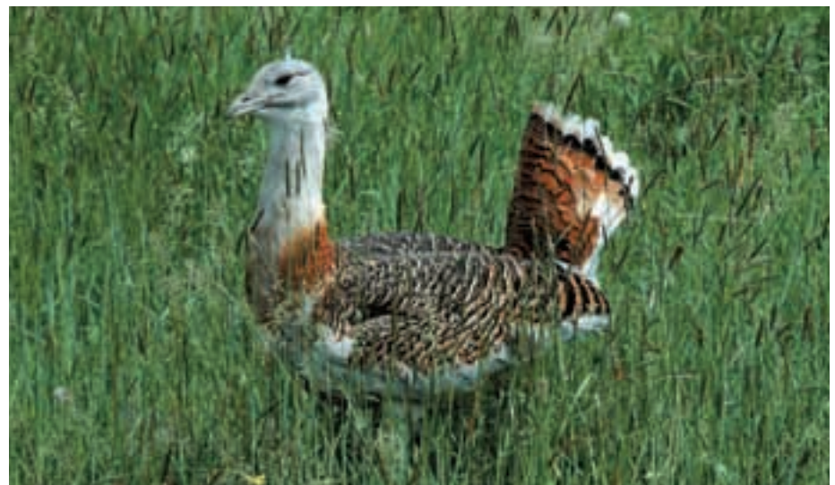
Abb. 39: Die Großstrappe ( Otis tarda ) kommt auch in Hustain Nuruu vor. The Great bustard occurs also in Hustain Nuruu.

men hier Marale ( Cervus elaphus maral , Abb. 36) und im Randgebiet die Mongolische Gazelle ( Procapra gutturosa ) vor. Zahlreich sind auch die scheuen Murmeltiere ( Marmota bobak , Abb. 37). Der Wolf ( Canis lupus , Abb. 42), der überall in der Mongolei stark verfolgt wird, hat sich im geschützten Park wieder vermehrt. Über einen Zeitraum von 4 Jahren durchgeführte Kotuntersuchungen haben gezeigt, dass er sich vorwiegend von den Maralen ernährt, jedoch selten im Juni, wenn die Kühe ihre Kälber setzen und einzeln und sehr verborgen