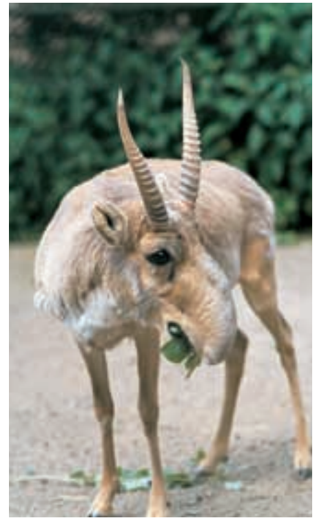
Abb. 25: Saiga-Antilopen ( Saiga tatarica ) gehören weltweit zu den bedrohtesten Tierarten. Saiga-antelopes belong to the most threatened species in the world.