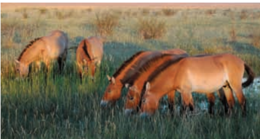
Abb. 45: Das einstmals überweidete Gebiet von Khomiin tal hat sich nach dem Zaunbau innerhalb eines Jahres erholt und bietet den Przewalskipferden jetzt bestes Futter.

Das Zucht- und Forschungszentrum für „Seltene und Bedrohte Wildtierarten“ liegt ebenfalls in der Gansu-Provinz, 25 km entfernt von der Millionenstadt Wuwei, untersteht aber der staatlichen Forstverwaltung. Wuwei wird von Wanderdünen der Tengeli-Wüste bedroht, und die Chinesen pflanzen Setzlinge von Tamarisken