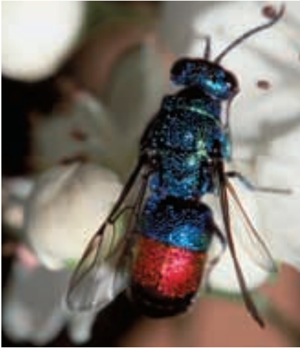
Abb. 8: Die Goldwespe ( Chrysis fulgida ) ist in ihrem Lebenszyklus abhängig von einer Lehmwespe und einem Käfer; letzterer ernährt sich nur von kleinwüchsigen Weiden, die durch den Verbiss der Pferde und der Rinder entstehen.

The Cuckoo wasp is dependant on a rare potter wasp which feeds on a beetle, which in turn feeds on low willows, whose growth form is influenced by the impacts of horses and cattle.