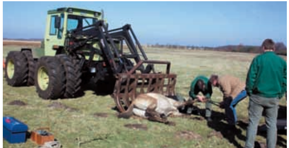
Abb. 11: Im Semi-Reservat von Sprakel wird ein betäubter Hengst auf die Gabel eines Traktors geladen und nach erfolgter Hufkorrektur zum Anhänger gebracht. In Sprakel an immobilized stallion is carried on a fork of a tractor to the trailer, after his hooves had been trimmed.

Das Semi-Reservat SPRAKEL, im Emsland gelegen, ist 68 ha groß und eignet sich daher – wie EELMOOR MARSH – für die Beweidung mit Hengsten. Przewalskiahengste können sehr aggressiv werden, wenn sie 5 Jahre und älter werden (KOLTER & ZIMMERMANN, 2001). Nur in großen Gebieten, die auch mit Büschen und Bäumen bestanden und topografisch so gestaltet sind, dass sich die Pferde aus dem Weg und außer Sicht gehen können, lassen sie sich erfolgreich halten. Erschwerend kommt hinzu, dass der Bestand wechseln muss und immer wieder ein neues