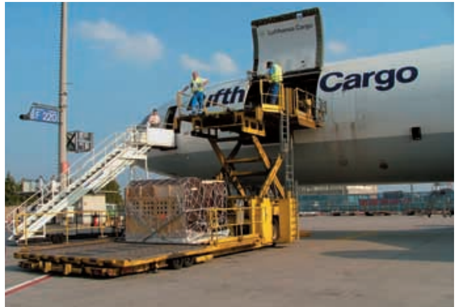
Abb. 50: 6 Przewalskihengste aus dem EEP auf ihrem Weg nach Urumqi. 6 Przewalski's horse stallions from the EEP on their way to Urumqi.

duced in their former habitats in Asia where large areas became strictly protected and thus also plants and other animal species profited from. Not all reintroduction attempts were successful so far or ever will be. Whether a project develops positively can easily be checked via the relevant websites. If no news are any more available, this is more likely to show a failure. In the table the various projects are clearly laid out.