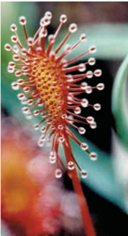
Abb. 7: Sonnentau ( Drosera intermedia ) in Eelmoor Marsh. Long-leaved sundew in Eelmoor Marsh.

Pflanzenfressern ohne Zufütterung ganzjährig gehalten werden kann.“ Diese nüchterne Interpretation gibt nicht die Bedeutung wieder, die Semi-Reservate für das EPP haben (ZIMMERMANN, 1997). Sie dienen nicht nur als weitere Haltungs- und Zuchtstätten, sondern hier können erstmals Beobachtungen unter naturnahen Bedingungen gemacht werden, die so im Zoo nicht möglich sind. Zahlreiche Examens-, Diplom- oder Doktorarbeiten sind hier schon entstanden. Aber auch immer mehr Naturschutzgebiete bedienen sich heute der Hilfe von Pferden und Rindern, um Flächen offen zu halten, d.h. vor dem Verbuschen zu bewahren (KOLTER et al., 1999). Eine solche „extensive Pflege“ ermöglicht auch den Erhalt der biologischen Vielfalt von Flora und Fauna, und es entstehen manchmal kleinräumige Biotope, in denen sich neue Pflanzen- und Tierarten ansiedeln. Da über die holländischen Semi-Reservate bereits in der Einführung berichtet wurde, werden sie in der folgenden Übersicht ausgelassen. Die Webseite für weiterführende Informationen ist jeweils am Ende eines Kapitels aufgeführt. www.treemail.nl