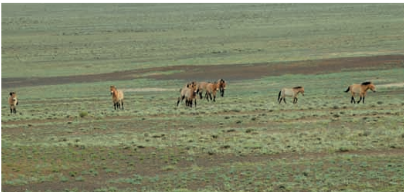
Abb. 47: Przewalskipferde im Kalameili-Reservat. Przewalski's horses in the Kalameili Reserve.

Das KALAMEILI NATURRESERVAT selbst ist 1.700.000 ha groß und sein Biotop ähnelt dem der Gobi B. Es ist zwar doppelt so groß, aber die wüstenartigen Landstriche nehmen mehr Raum ein, vor allem im Westen. 200 km östlich der Gobi B gelegen, gehört es zum ursprünglichen Verbreitungsgebiet von Przewalskipferd und Saiga-Antilope. Beide Tierarten starben hier in den 50er Jahren des letzten Jahrhunderts aus. Heute gibt es