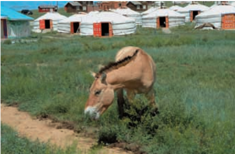
Abb. 40: Der 16-jährige Hengst Ares stammt aus dem Kölner Zoo und hält sich manchmal im Touristencamp auf.

The 16 years old stallion Ares originates from Cologne zoo and sometimes visits the tourist camp.