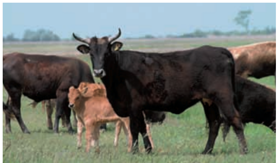
Abb. 22: Sayaguesa-Rinder beeinflussen positiv die Zucht der „Aurochs“ (im Bild eine Kreuzungskuh).

5,13 Przewalskipferde wurden von 1997 bis 2001 in dieses Reservat gebracht (Abb. 21). Heute leben hier 67 Pferde in 7 Harems- und 1 Junggesellengruppe; 17 Fohlen sind allein