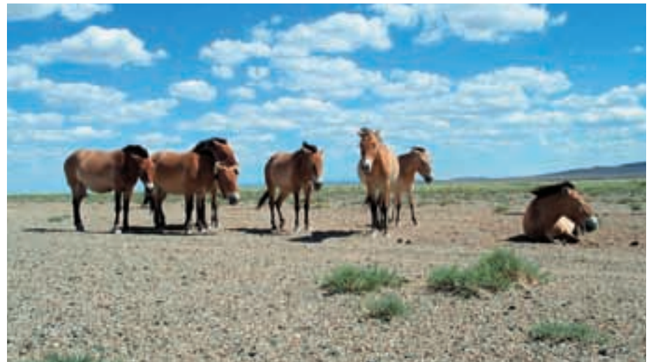
Abb. 43: Eine Haremsgruppe mit drei Kölner Stuten ist in diesem Jahr in Tachin us freigelassen worden.

KHOMIIN TAL gehört zur Pufferzone des KHAR US NUUR NATIONALPARK, eine Wiedereinbürgerung an dieser Stelle ist daher derzeit ausgeschlossen. Der Park liegt im Westen der Mongolei in der Ebene der großen Seen