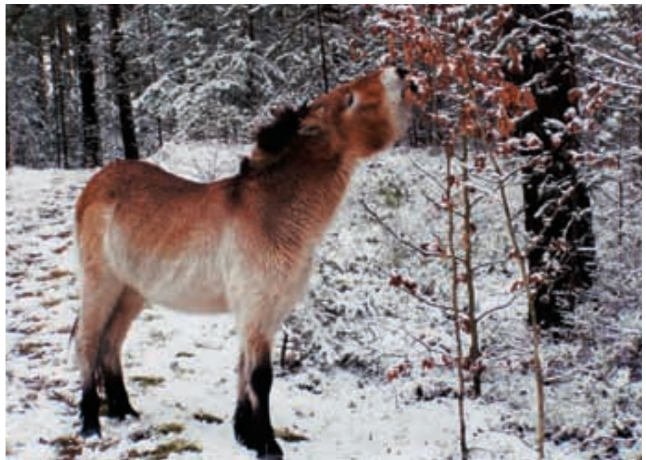
Abb. 13: Ein Przewalskipferd im Tennenloher Forst beim Verbeißen von jungen Bäumen. A Przewalski's horse in the Tennenlohe Forest feeding on young trees.

Der TENNENLOHER FORST war Militärgebiet der Amerikaner. Es handelt sich um ein Sandbiotop bei Erlangen mit einem hohen ökologischen Wert (Abb. 14). Allein 300 Tier- und Pflanzenarten, die hier vorkommen, stehen auf der Roten Liste. Heideflächen mit Heidekraut ( Calluna spec. ) und Besenginster ( Cytisus scoparius ), feuchte Niederungen mit Sonnentau ( Drosera rotundifolia , Abb. 7) und Sandmagerrasen mit Silbergras ( Corynephorus canescens ) wechseln miteinander ab. Mit dem Abzug von schwerem militärischen Gerät, das die Landschaft offen gehalten hatte, drohten diese Biotope zu überwachsen. Östlich des großen Kugelfangwalls wurden 53 ha auf der ehemaligen Schießbahn eingezäunt. Seit 2003 betreiben Przewalskipferde des Münchner und Nürnberger Zoos hier Landschaftspflege (Abb. 13). Im eingezäunten Gatter brüten Ziegenmelker und Heidelerche (Abb. 15) und