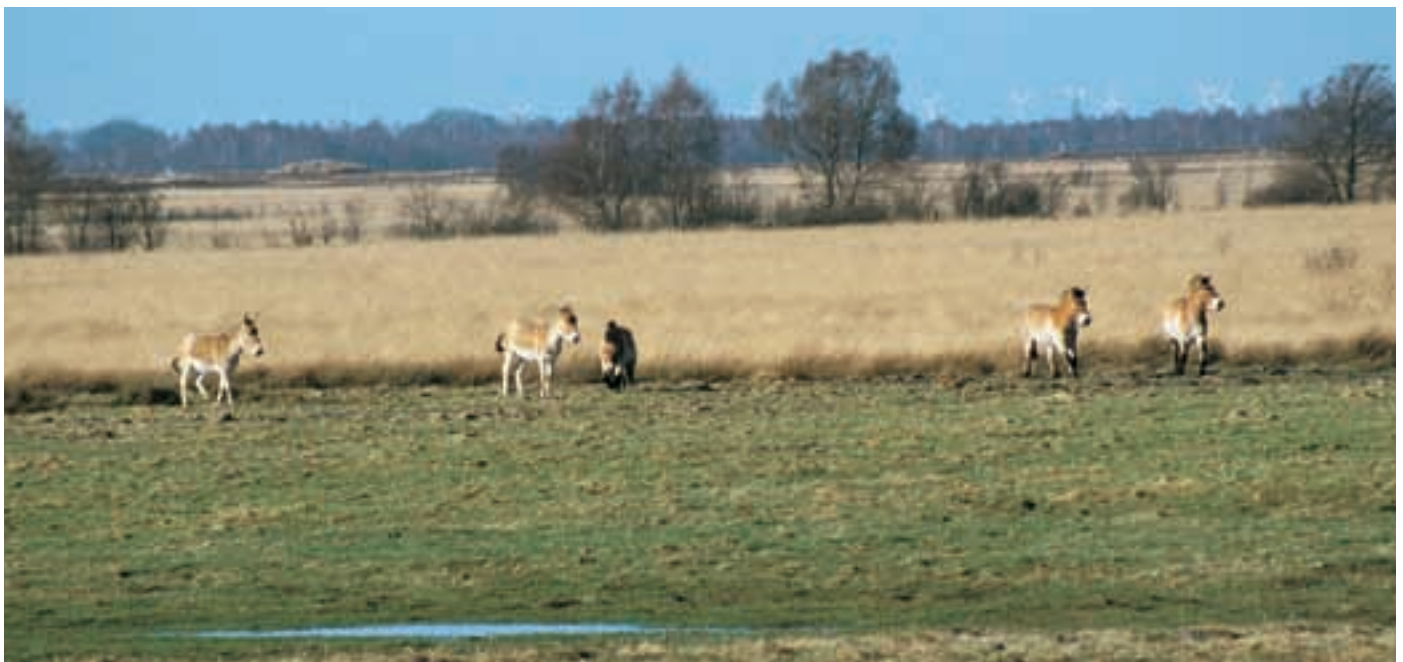
Abb. 12: Przewalskiahengste (rechts) und Onagerhengste (links) im Semi-Reservat von Sprakel. Przewalski's horse stallions (right) and Onager stallions (left) in the semi-reserve of Sprakel.

hat man darauf, wo der Hengst schließlich in Narkose fällt. Da dies auch in dem sumpfigen Teil passieren kann, muss ein Traktor bereitstehen, der das Pferd zum Anhänger tragen kann (Abb. 11). In diesem Jahr holte der Kölner Zoo den Hengst „Erich“ aus SPRAKEL, um nach 4-jähriger Pause wieder zu züchten. In Stuttgart geboren, wuchs er 4 Jahre im Reservat auf. Obwohl er mit Menschen kaum noch in Kontakt kam, ließ er sich leicht wieder an Zoobedingungen gewöhnen. Zwei weitere Hengste aus diesem Gebiet traten in diesem Jahr den Weg nach China an (siehe unten).