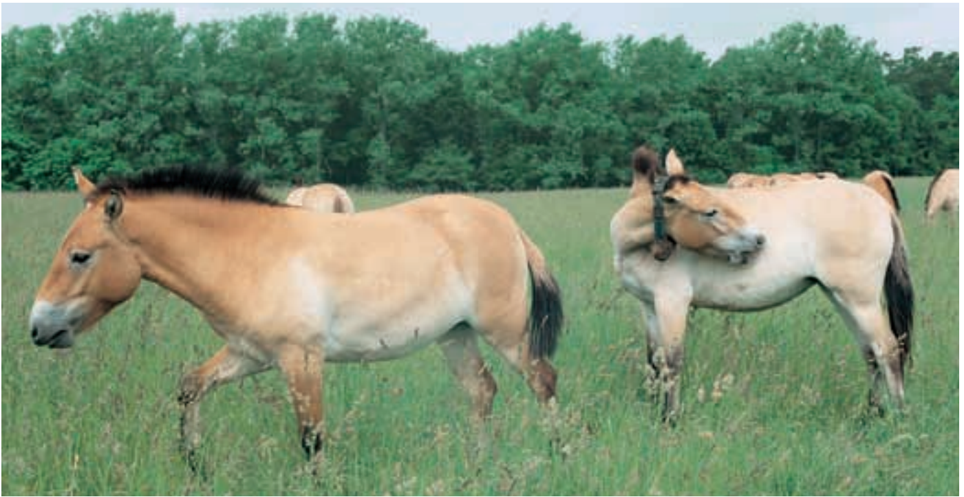
Abb. 16: Przewalskipferde mit Sendehalsbändern in der Schorfheide. Przewalski's horses with radio collars in the Schorfheide.