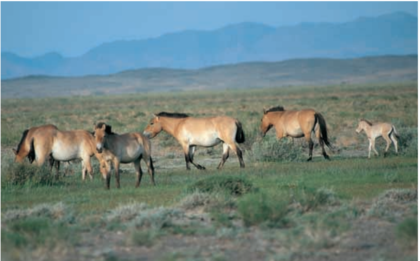
Abb. 1: Przewalskipferde in der Gobi B. Der Leithengst Pas stammt aus Askania Nova und ist mit 16 Jahren einer der ältesten Hengste in diesem Gebiet.

Przewalski's horses in the Gobi B. The 16 years old harem stallion Pas was born in Askania Nova and is one of the oldest in this area.