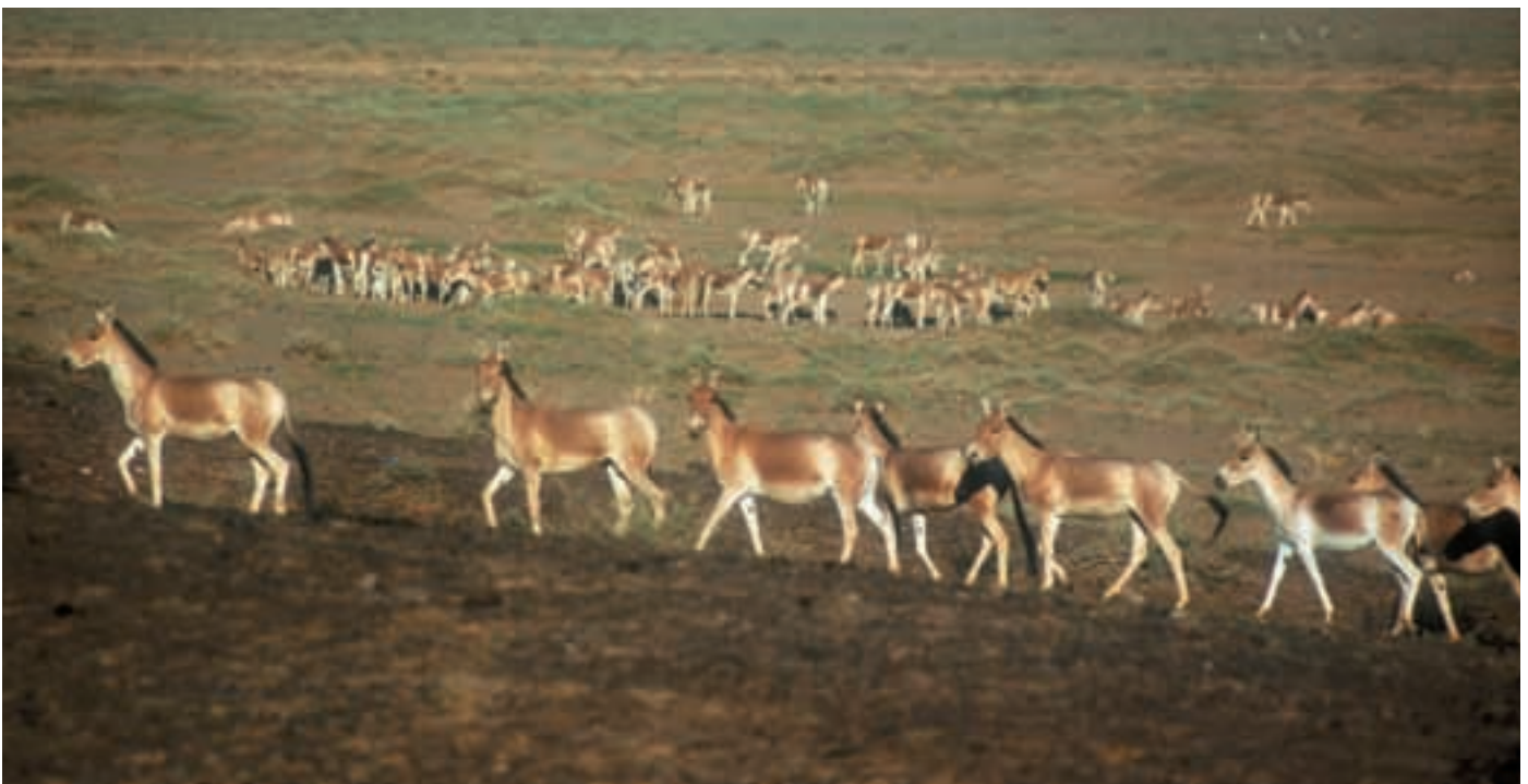
Abb. 41: Dschiggetais ( Equus b. hemionus ) in der Gobi B. Dziggetais in the Gobi B.

Ob das Przewalskipferd jemals in dieser Bergsteppe gelebt hat, ist strittig, doch hat es sich erfolgreich an die Bedingungen angepasst. Der Winter ist sehr lang; Er kann schon im September einsetzen und bis Mai dauern. Ohne die exzellente Futtergrundlage wäre der Winter für die Przewalskipferde wohl eine ernsthafte Klippe im Kampf ums Überleben. Von 1992 an bis Ende 2005 ist die Population auf ca. 180 Tiere angestiegen. Es handelt sich um das erste Projekt, das unabhängig wurde vom Nachschub aus Europa, und es wird inzwischen unter rein mongolischer Regie hervorragend geführt. Die günstige Lage zur Hauptstadt Ulan bator lässt einen bescheidenen, aber einträglichen Tourismus zu. Viele Ökotouristen helfen in den Sommermonaten, einfache Daten, wie z.B. Standort und Aktivität, zu den einzelnen Przewalskigruppen zu erheben. Vom Kölner Zoo ging 1996 der inzwischen 16-jährige Hengst Ares in das Steppengebiet. Die Leitung seines Harems hat er längst an einen jüngeren Hengst abtreten müssen, aber Ares hat die Nähe des Touristencamps zu schätzen gelernt: Hier hat er seine Ruhe vor