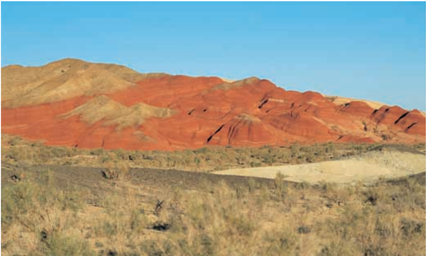
Abb. 31: Die Landschaft im Altyn Emel Nationalpark ist atemberaubend schön. The landscape in the Altyn Emel NP is stunning.