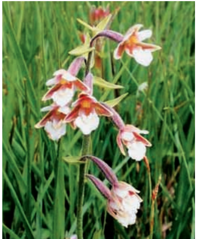
Abb. 6: Sumpfstendelwurz ( Epipactis palustris ) in Eelmoor Marsh. Marsh helleborine in Eelmoor Marsh.