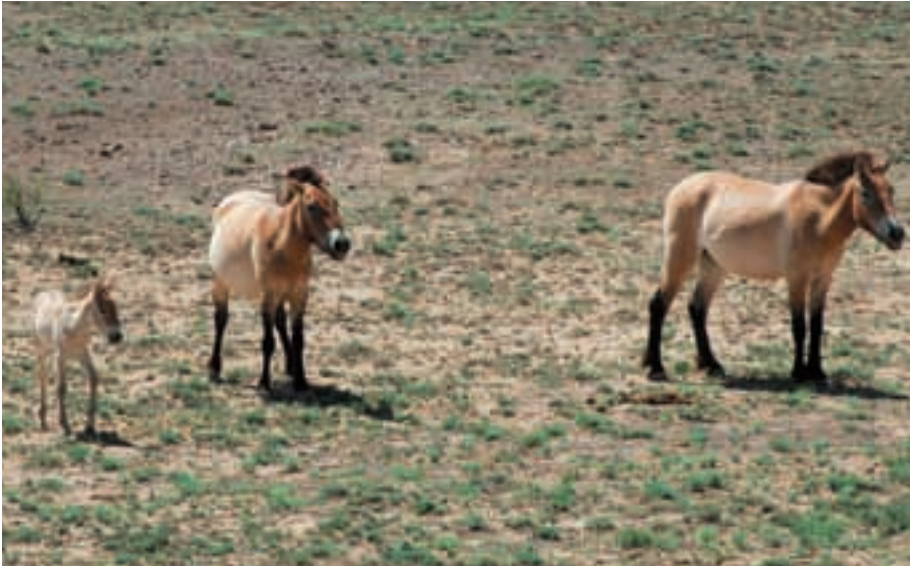
Abb. 48: Das erste in diesem Jahr im Kalameili-Reservat geborene Fohlen. This year's first foal born in the Kalameili Reserve.

hier gute Bestände von Dschiggetais und Kropfgazellen (Abb. 46). In den Kalameili-Bergen kommen auch Argali-Schafe und Sibirische Steinböcke vor. Der Druck durch Wilderei ist hier deutlich geringer als in der Mongolei, da die Chinesen sehr viel strengere Gesetze haben und Waffen nicht tragen dürfen.