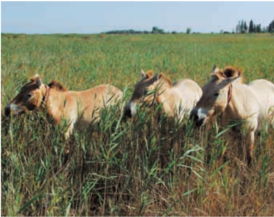
Abb. 19: Im Nationalpark Neusiedler See helfen die Przewalskipferde, den Schilfgürtel klein zu halten. Sie tragen Mikrochips unter der Haut und Halsbänder mit Sendern, die Aufschlüsse über jahreszeitliche Aktivitäten, Herzschlagfrequenz und Unterhauttemperatur geben. At the National Park Neusiedler See, Przewalski's horses help to reduce the growing reed. They have implanted microchips and wear radio-collars to monitor activity, heart-beat frequency and subcutaneous temperature throughout the year.

Jahresverlauf aufzeichnen, die sich abrufen lassen (Abb. 16). Außerdem kann mittels eines implantierten Chips ein Pferd zweifelsfrei an einer Tränke identifiziert und sein täglicher Wasserverbrauch gemessen werden (Abb. 17; SCHEIBE et al., 1998). Oder aber es wurde der Frage nachgegangen, wie