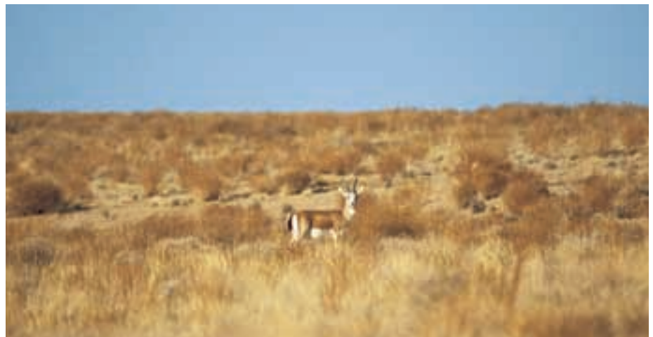
Abb. 46: Ein Kropfgazellenbock ( Gazella subgutturosa ) im Kalameili-Reservat. A male goitered gazelle in the Kalameili Reserve.

Da es keine Meldungen von den Przewalskipferden gibt, ist unbekannt, wie viele nachgezüchtet wurden. Unwahrscheinlich ist aber die Aussage, dass die Mauer des Semi-Reservates nach 10 Jahren gefallen ist und es hier zu einer Wiedereinbürgerung kommen kann. Die Wahrscheinlichkeit ist größer, dass ein neuer Platz für sie gesucht wird: Eine Ausgabe der Zeitung CHINA DAILY meldete 2004, dass von Gansu 18 Przewalskipferde nach ANXI gebracht werden sollten. Dies ist bislang jedoch nicht geschehen (JIE CAO, pers. Mitt.) Die Zukunft dieses Projektes, das immerhin einen