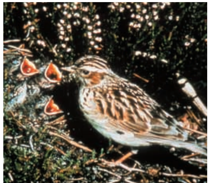
Abb. 15: Heidelerchen ( Lullula arborea ) brüten in Eelmoor Marsh, Clocaenog Forest und im Tennenloher Forst.