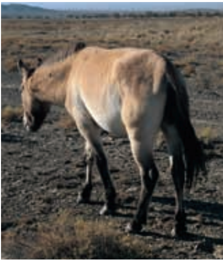
Abb. 33: Im Herbst letzten Jahres waren alle Pferde sehr dünn. In autumn last year all horses were quite thin.