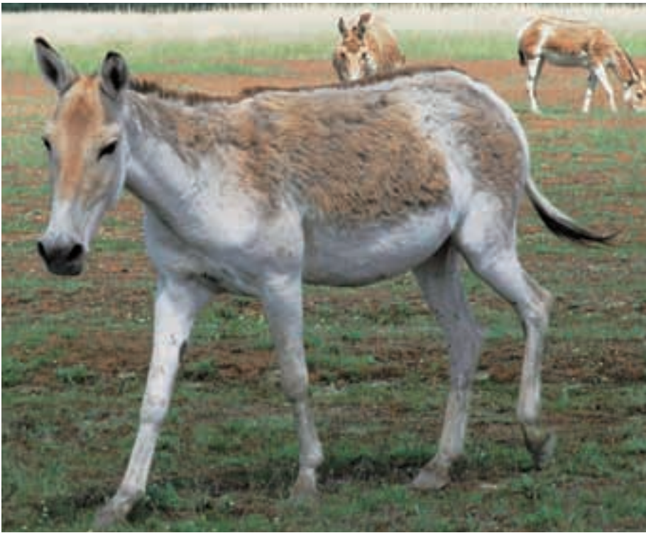
Abb. 24: Kulane ( Equus hemionus kulan ) leben in den Reservaten von Askania Nova, Bucharra und im Altyn-Emel-Nationalpark. Kulans live in the reserves of Askania Nova, Bukhara and in the Altyn Emel NP.