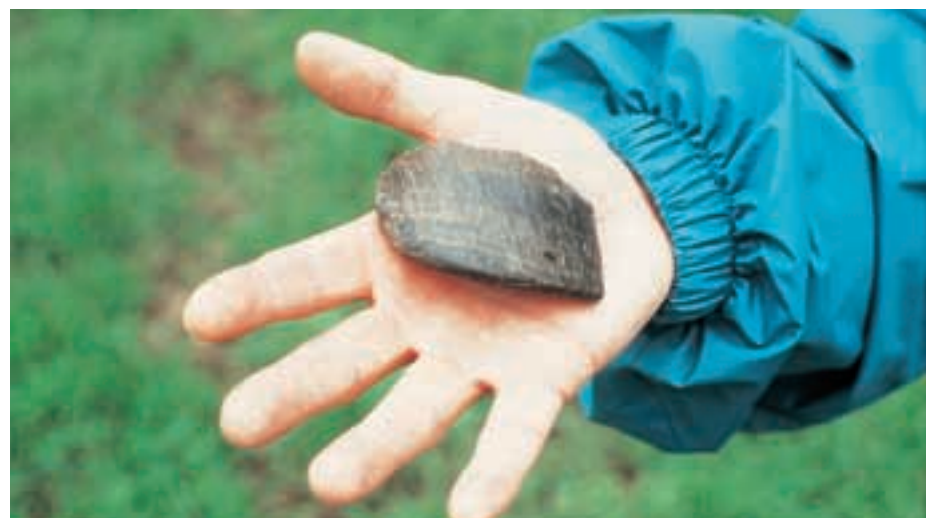
Abb. 18: Wildpferde haben im Huf eine Art Sollbruchstelle. Zu Beginn des Sommers brechen ganze Hufhornstücke aus. Wild horses have predetermined breaking points in their hoof-horn, which brakes off at the beginning of summer.

Von Beginn an wurden vom INSTITUT FÜR ZOO- UND WILDTIERFORSCHUNG (IZW) in Berlin und