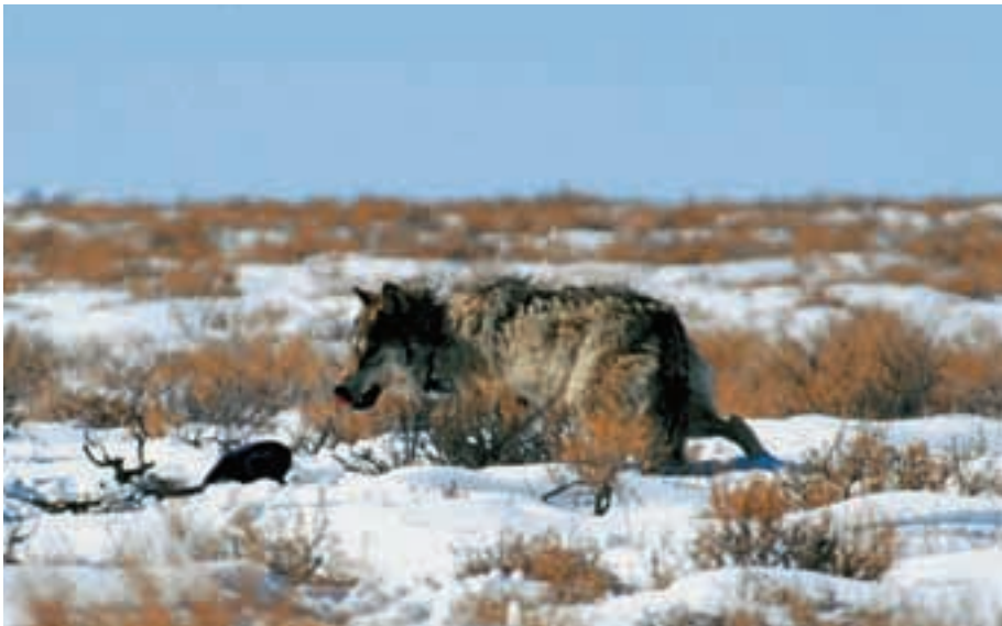
Abb. 42: Ein Wolf ( Canis lupus ) wurde besendert, um seine Reviergröße und bevorzugten Aufenthaltsorte ermitteln zu können.

A wolf is wearing a radio-collar to get notice from the size of his territory and preferred whereabouts.