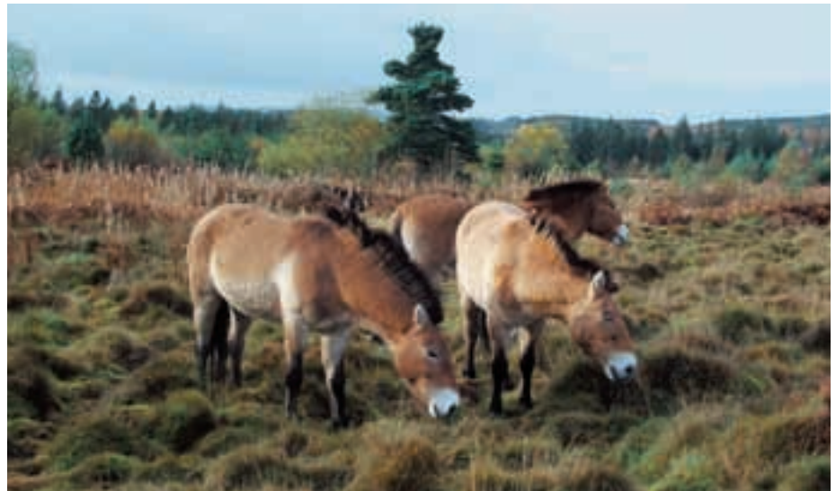
Abb. 10: Przewalskistuten in Clocaenog Forest bewahren eine antike Fundstätte aus der Jungsteinzeit und Eisenzeit vor der Verbuschung.

Przewalski mares in Clocaenog Forest graze on an ancient area from the Neolithic/Iron age.