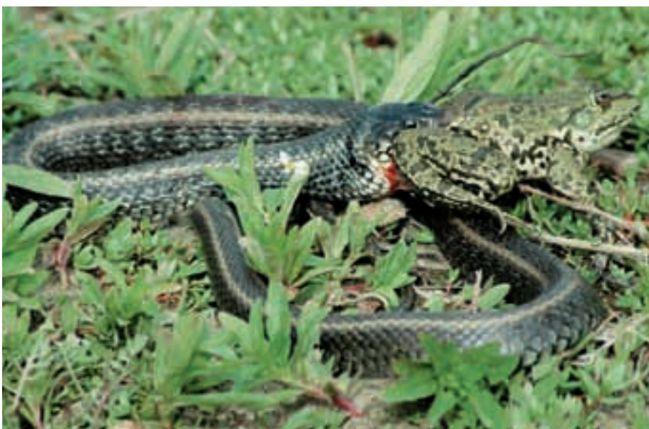
Abb. 20: Eine Ringelnatter ( Natrix natrix ) hat einen Frosch gefangen. A grass snake is feeding on a frog.

sich das Hufwachstum reguliert (Abb. 18; BUDRAS et al., 1996). Jede einzelne neue Information ist wichtig, um mehr über das Przewalskipferd zu erfahren, das in seiner Heimat nicht erforscht werden konnte. Da die Eigentumsansprüche an der Fläche zum Zeitpunkt der Wende offensichtlich nicht