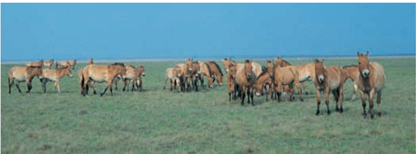
Abb. 26: Askania Nova ist durch seine Przewalskipferdzucht bekannt geworden. Hierher kamen die ersten Wildfänge (1899) und 1957 der letzte Wildfang, die Stute 231 Orlitza III .

In die Geschichte eingegangen ist ASKANIA NOVA aber wegen seiner