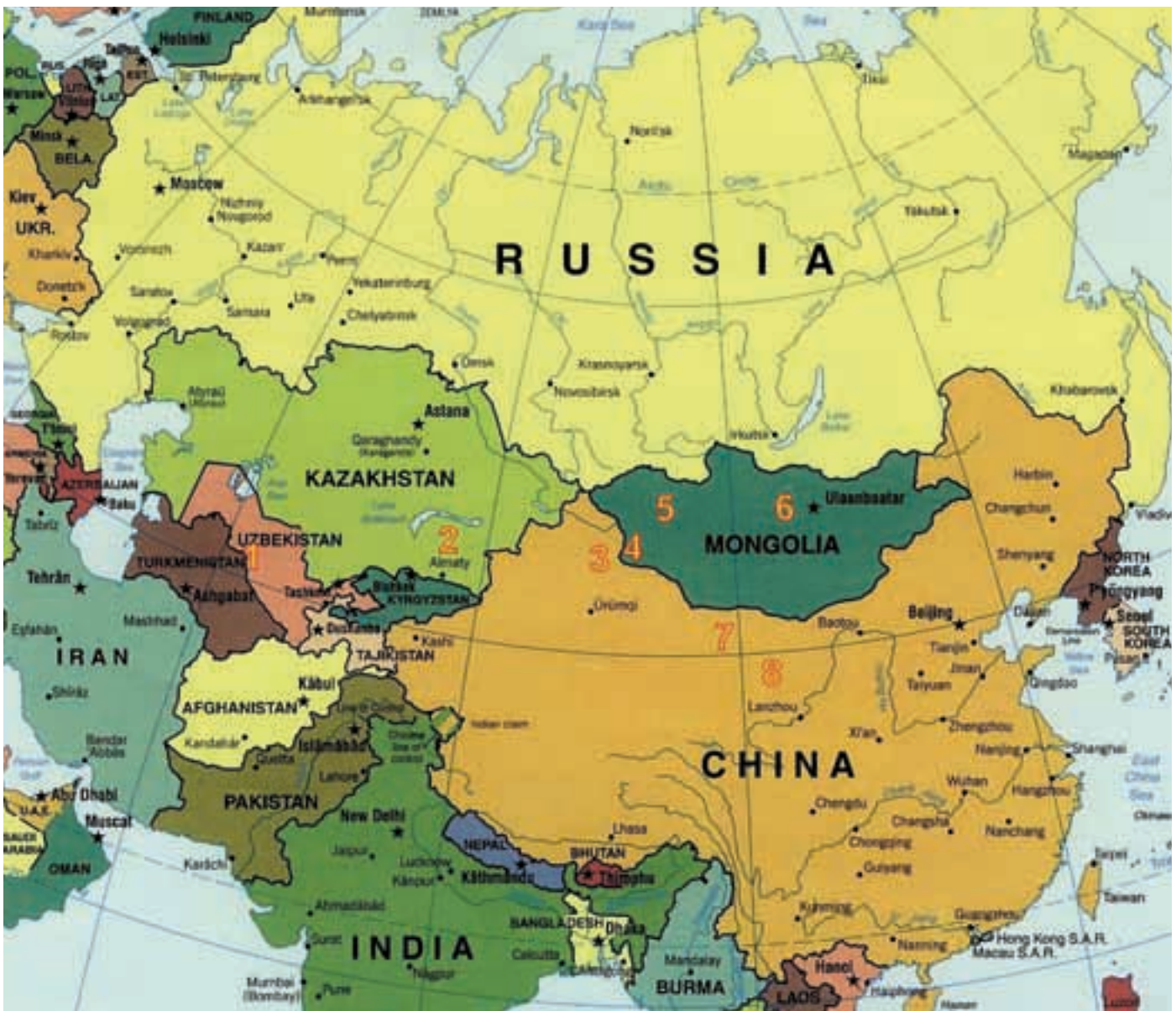
Abb. 29: Reservate und Wiedereinbürgerungsprojekte in Asien (Reserves and re-introduction projects in Asia): 1 Buchar-Reservat, 2 Altyn Emel Nationalpark, 3 Kalameili-Reservat, 4 Gobi B Nationalpark, 5 Khar us Nuur Nationalpark, 6 Hustai Nationalpark, 7 Anxi Naturreservat, 8 Gansu Semi-Reservat.