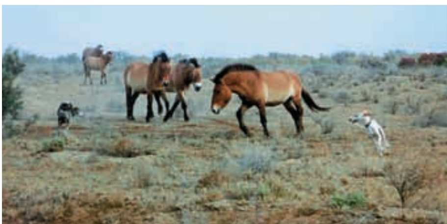
Abb. 30: Im Buchar-Reservat testen Hunde die Reaktion der Przewalskipferde auf Feinde, denn Wölfe gibt es in dem Reservat nicht. In the Bukhara reserve, dogs take the place of predators to challenge the Przewalski's horses and to test their responsiveness. Wolves are absent in the park.