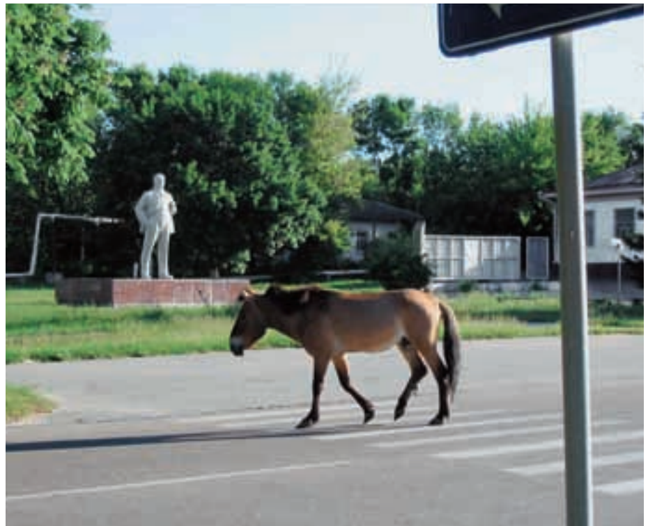
Abb. 28: Ein Hengst, vermutlich ein Hybride, läuft durch die Straßen von Chernobyl. A stallion, probably a hybrid, is walking through Chernobyl.

1989 und 1999 wurden insgesamt 31 Przewalskipferde aus ASKANIA NOVA hierher gebracht, die sich in den letzten Jahren erfolgreich auf einen Bestand von 70 Pferden vermehrt haben (DVOJNOS et al., 1999; ZHARKIK et al., 2002). Es handelte sich um alleamt von der Zucht ausgeschlossene Tiere (Abb. 27). Es wird berichtet, dass bislang keine Schäden bei ihnen aufgetreten sind, die auf radioaktive Bestrahlung zurückgehen könnten, und der Populationsanstieg bestätigt dies. Die Überlebensrate der Fohlen war bislang mit ca. 90% sehr hoch. Leider wurden in der Umgebung auch Hauspferde gehalten, so dass von einer weiteren Hybridisierung ausgegangen werden muss (Abb. 28). Regelmäßig kommen Mitarbeiter von ASKANIA NOVA hierher, um nach den Pferden zu schauen und Abgänge und Zugänge zu registrieren. Bislang sind diese Daten auch dem Zuchtbuch gemeldet worden. Prognosen über eine zukünftige Entwicklung kann man zu diesem Zeitpunkt sicher nicht machen. Bestand: derzeit 70 Pferde www.chernobyl.in.ua