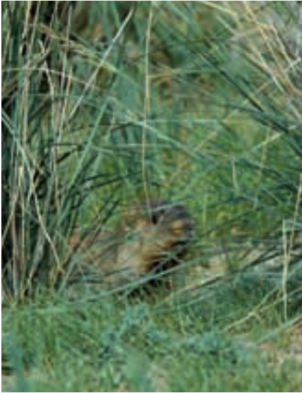
Abb. 37: Die Murmeltiere ( Marmota bobak ) sind sehr scheu. The marmots are very shy.

lautet wie folgt: “ Re-introduction: an attempt to establish a species in an area which was once part of its historical range, but from which it has been extirpated or become extinct. ” (Wiedereinbürgerung: der Versuch, eine Art wieder in einem Gebiet anzusiedeln, das einst Teil ihres historischen Verbreitungsgebietes war, wo sie jedoch ausgerottet wurde oder ausstarb). Eine Wiedereinbürgerung beinhaltet demzufolge auch, dass die Art – vom Menschen unabhängig – auf Dauer eine sich selbst erhaltende Population entwickeln muss. Das historische Verbreitungsgebiet des Przewalskipferdes umfasste die Dschungarische Gobi in China und der Mongolei sowie Bereiche im Westen der Mongolei bis hin zu Kasachstan. Genau ist dies nicht bekannt, aber einige Ortsnamen, die das Wort Tachi (mongolisch: Wildpferd; DULAMT SEREN, 1993) enthalten sowie Felszeichnungen geben Anhaltspunkte.