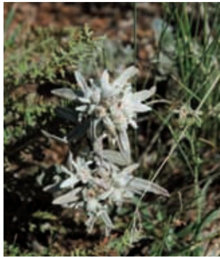
Abb. 34: Die Bergsteppenvegetation von Hustain Nuruu hat alpinen Charakter; das Edelweiß ( Leontopodium alpinum ) kommt hier häufig vor. The mountain steppe of Hustain Nuruu shows alpine character: the edelweiss is abundant.