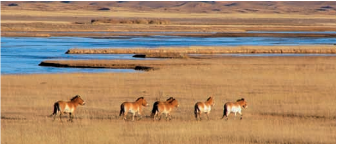
Abb. 44: Khomiin tal, die Pufferzone des Khar Us Nuur Nationalparks, wurde als Semi-Reservat für Przewalskipferde aus Le Villaret eingerichtet.

Khomiin tal, the buffer zone of the Khar Us Nuur NP, became a semi-reserve for a group of Przewalski's horses from Le Villaret.